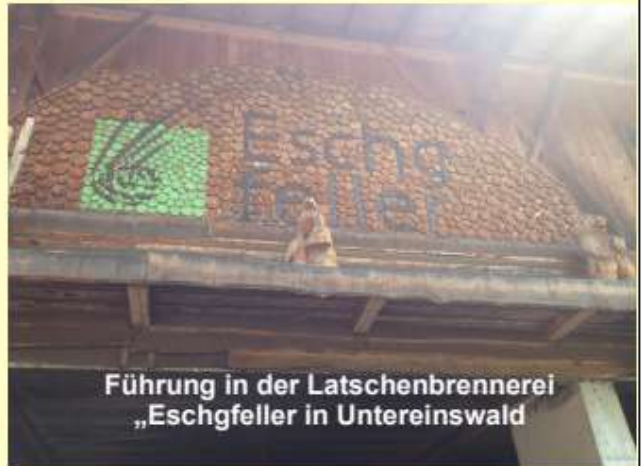
Führung in der Latschenbrennerei „Eschgfeller in Untereinswald