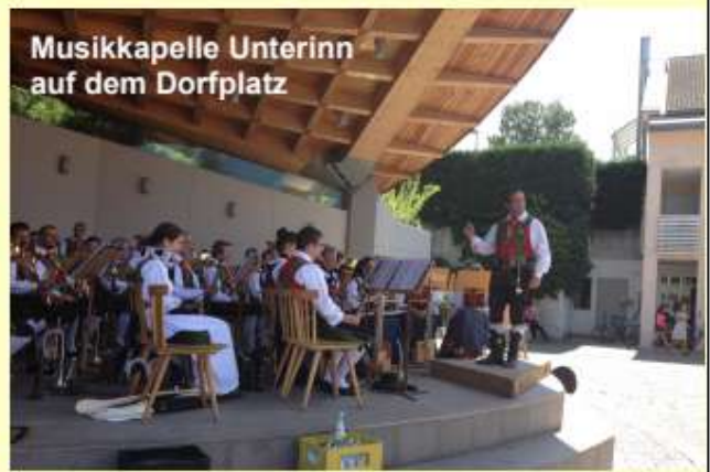
Musikkapelle Unterinn auf dem Dorfplatz