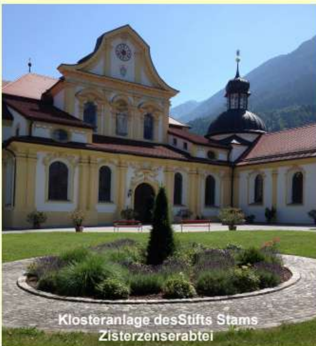
Klosteranlage des Stifts Sams Zisterzienserabtei