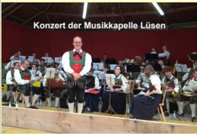
Konzert der Musikkapelle Lüsen