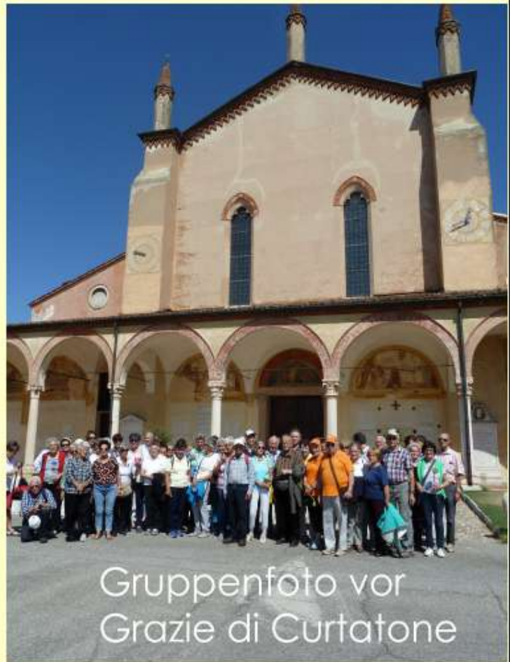
Gruppenfoto vor Grazie di Curtatone