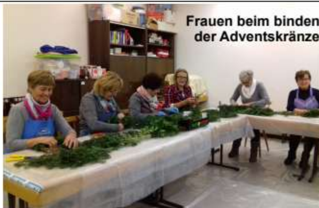
Frauen beim binden der Adventskränze