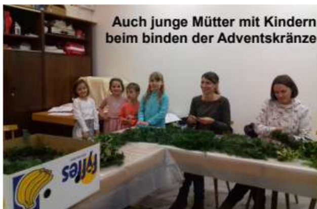
Auch junge Mütter mit Kindern beim binden der Adventskränze