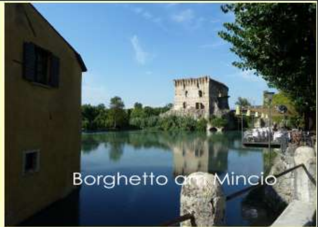
Borghetto am Mincio