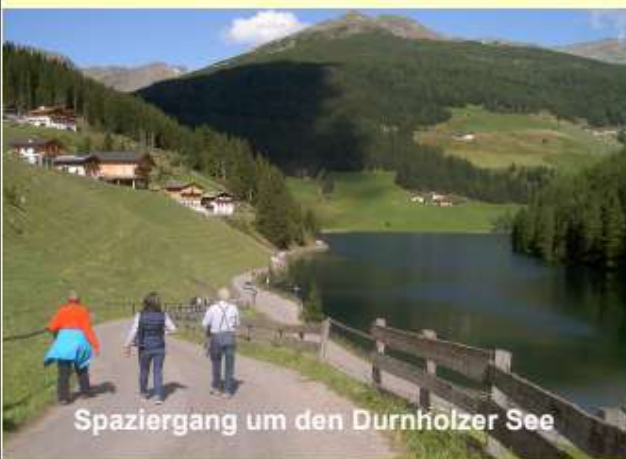
Spaziergang um den Durnholzer See