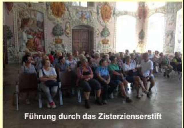
Führung durch das Zisterzienserstift