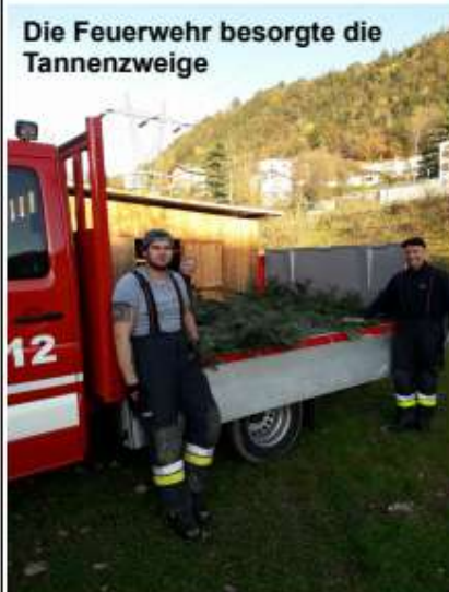
Die Feuerwehr besorgte die Tannenzweige