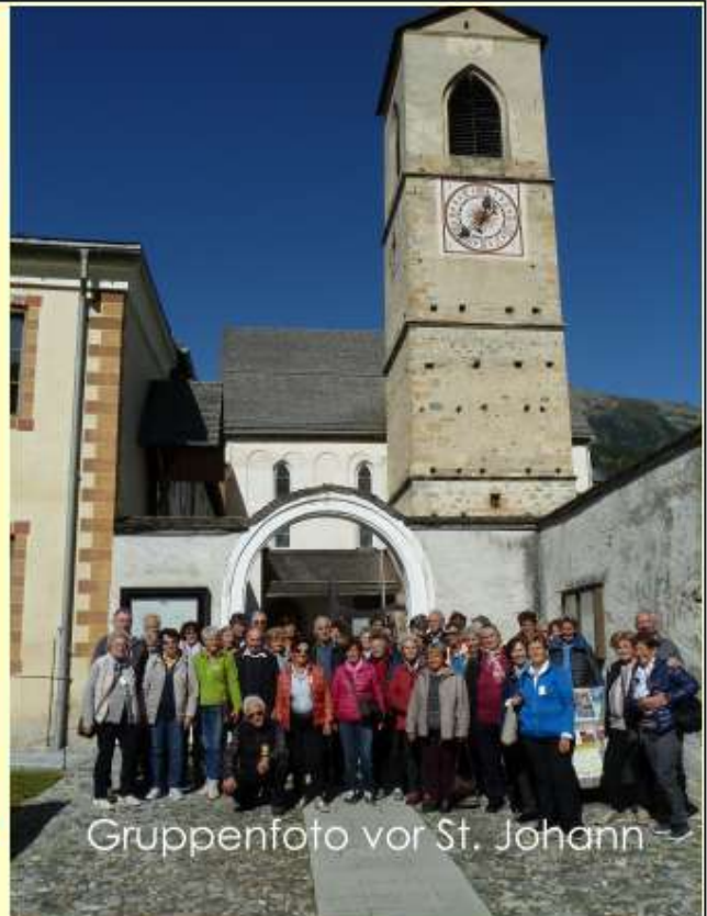
Gruppenfoto vor St. Johann