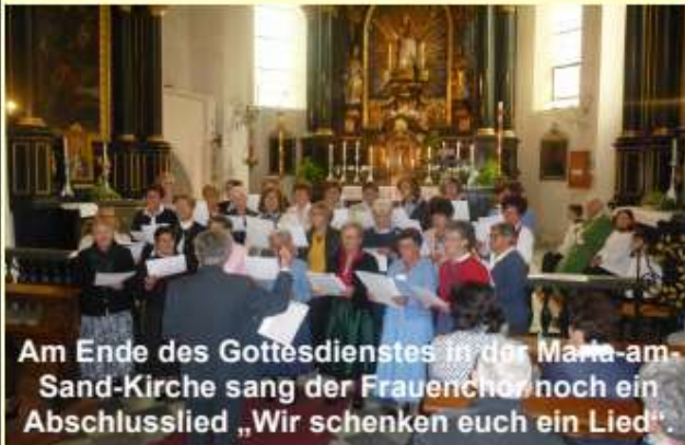
Am Ende des Gottesdienstes in der Maria-am-Sand-Kirche sang der Frauenchor noch ein Abschlusslied „Wir schenken euch ein Lied“.