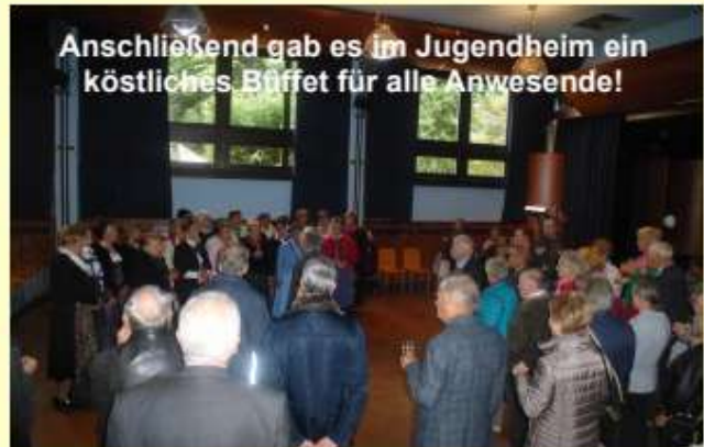
Anschließend gab es im Jugendheim ein köstliches Büffet für alle Anwesende!