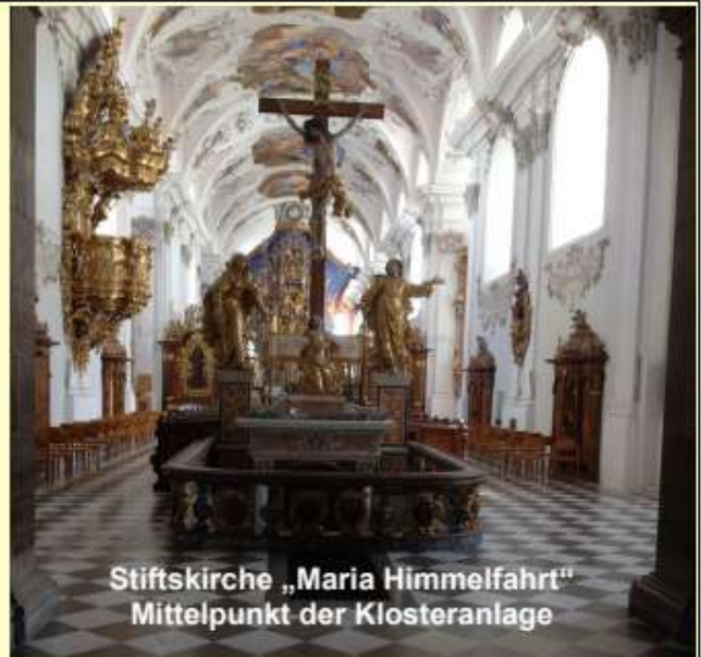
Stiftskirche „Maria Himmelfahrt“ Mittelpunkt der Klosteranlage

Kosten für Fahrt, Eintritt und Führung, Mittagessen*): € 47,00