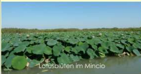
Lotusblüten im Mincio

Das Mittagessen wurde im Restaurant Da Claudio eingenommen. Serviert wurde ein typisches bodenständiges Menü. Nach dem Mittagessen ging die Fahrt weiter nach Valeggio sul Mincio in das malerische Dörfchen Borghetto. Mit der alten Mühle und den vielen kleinen mittelalterlichen Häusern ist Borghetto wirklich ein Paradebeispiel für ein altes, mittelalterliches Dorf. Nach einem kurzen Rundgang und einer kleinen Stärkung in einer typischen locanda wurde abends die Heimfahrt angetreten.