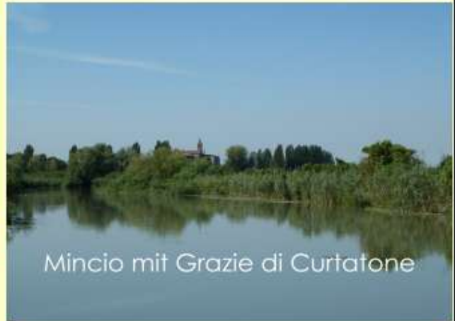
Mincio mit Grazie di Curtatone